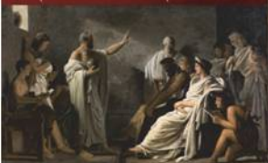
Ο Πυθαγόρας και οι μαθητές του Pierre-Narcisse Guerin

στις μαθητές μας να ξεπεράσουν σε προκοπή και αρετή όλους τους δασκάλους τους!!!