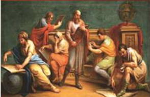
Ένας Έλληνας φιλόσοφος και οι μαθητές του Antonio Zucchi

«...Μέσα από μια αμοιβαία σχέση αγάπης και αυστηρότητας περνούν τα χρόνια της κοινής προσπάθειας, κι' όταν φτάσει η ώρα του χωρισμού, ο ώριμος προτέμπει τον νέο στη ζωή με την ευχή να γίνει καλύτερο καλύτερός του. Πέρα από την επιθυμία που έχει ο παιδευτής να καλλιεργήσει την επιστήμη του ο ίδιος, πολύ πιο μεγάλη ικανοποίηση νιώθει, όταν βλέπει πως ο μαθητής του κατόρθωσε να τον ξεπεράσει. Γιατί τα έθνη προκόβουν, όταν στην ατέμνηση αυτή λαμπραδηφορία η φλόγα της λαμπάδας στο κάθε νεότερο χέρι φουντώνει όλο και πιο πολύ...».