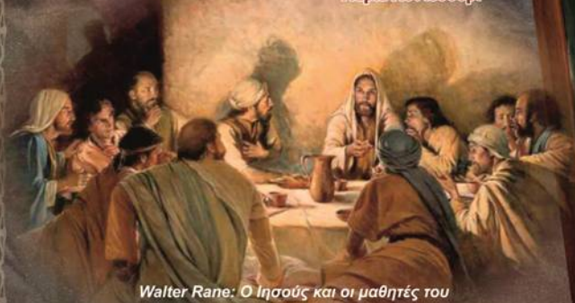
Walter Rane: Ο Ιησούς και οι μαθητές του

Το Διοικητικό Συμβούλιο του Συνδέσμου Φιλολόγων Αιγαίας & Καραβρύτων